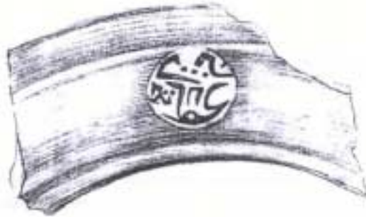
2-сурет. Кочкор-Башы шарынан табылган карпачнын сымгымдагы устанын мөңгү.