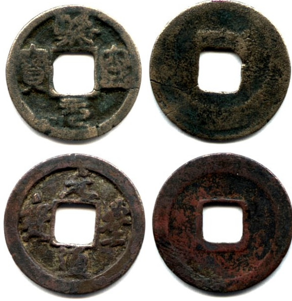
Resim 4 Resim 5