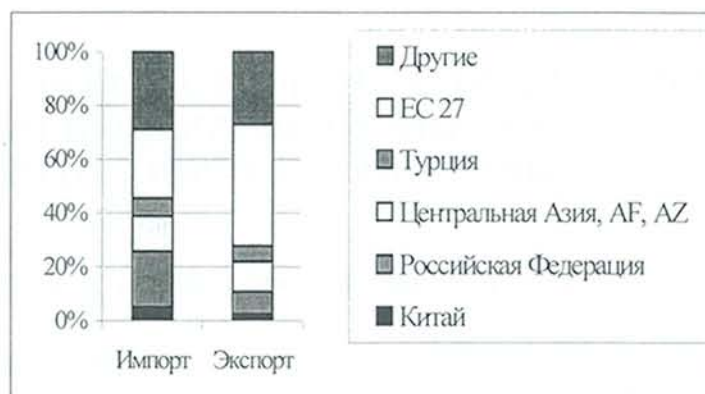
Рис. 1. Торговые партнеры стран Центральной Азии, Азербайджана и Афганистана