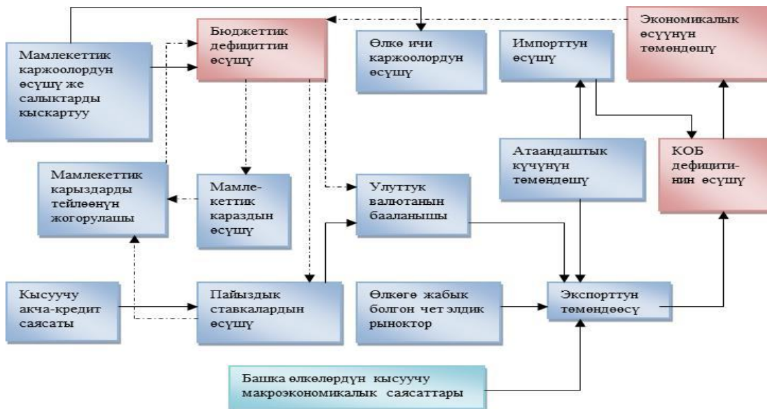
Рис. 1. Бюджеттик дефицит жана КОБ дефицити арасындагы байланыштын кеңири чагылдырылышы

8). Бул процессти төмөнкүчө түрүндө көрсөтүүгө болот (рис. 1).